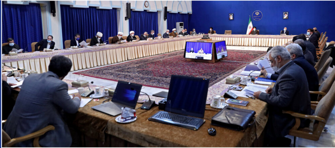
سالروز اعلام انقلاب فرهنگی