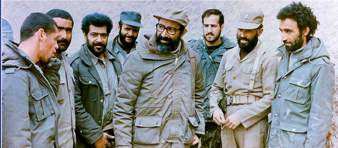
شهادت دکتر مصطفی چمران / روز بسیج استادان