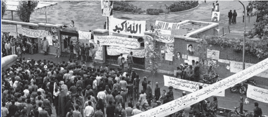
تسخیر سفارت آمریکا به دست دانشجویان پیرو خط امام (ره)