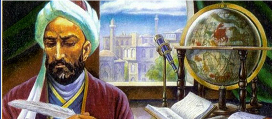
روز بزرگداشت خواجه نصیرالدین طوسی / روز مهندسی