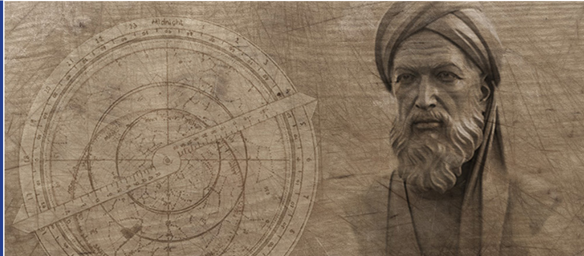
روز میلاد خوارزمی / روز فناوری اطلاعات