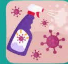
لقطه سطوح را ضدعفونی کنید