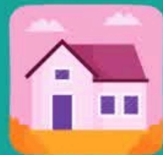
در خانه بمانید