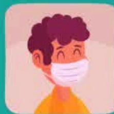
حتماً از ماسک استفاده کنید