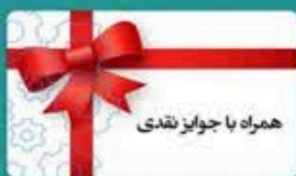
همراه با جوایز نقدی