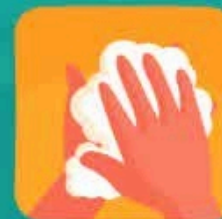
دستار خود را با آب و صابون بشوید