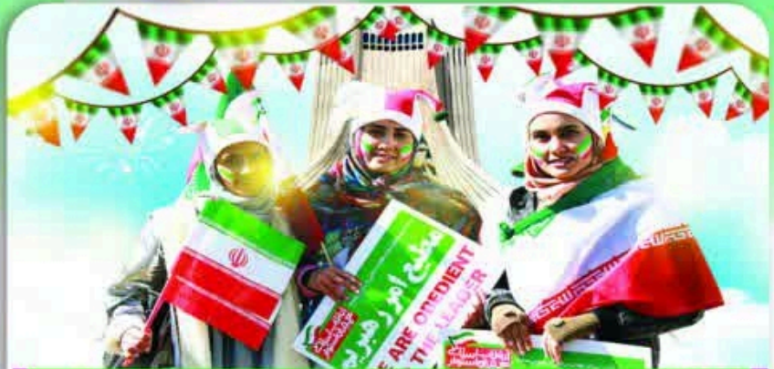
جشن شکوهمند پیروزی انقلاب اسلامی به صورت مجازی برگزار شد