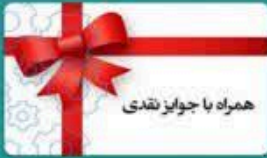
همراه با جوایز نقدی