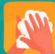
دستانتان خود را با آب و صابون بشوید