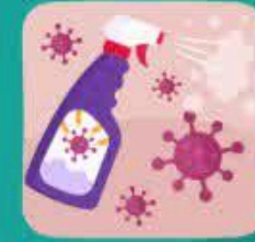
دستانتان را با ضدعفونی کننده بشوید