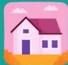
در خانه بمانید