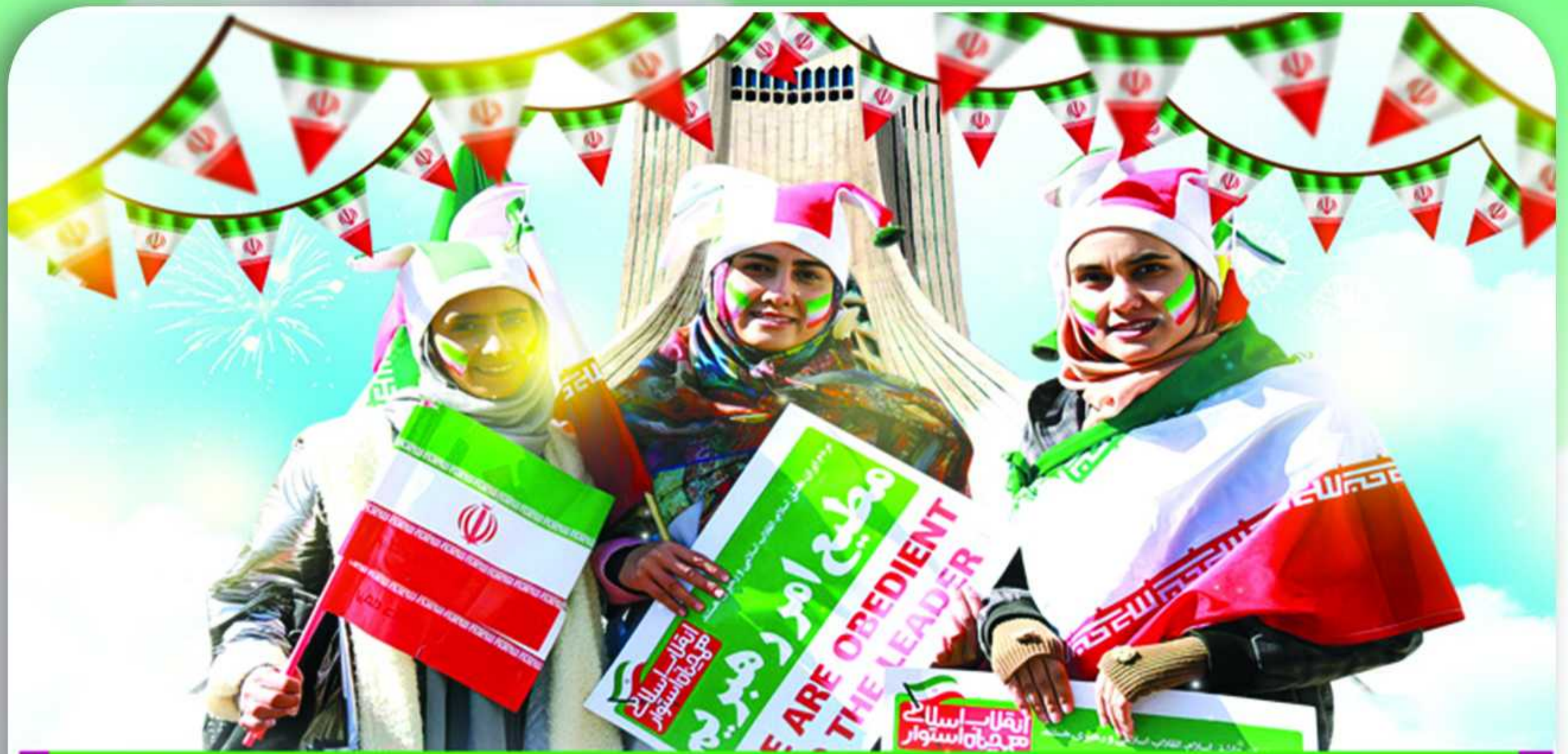
جشن شکوهمند پیروزی انقلاب اسلامی به صورت مجازی برگزار شد