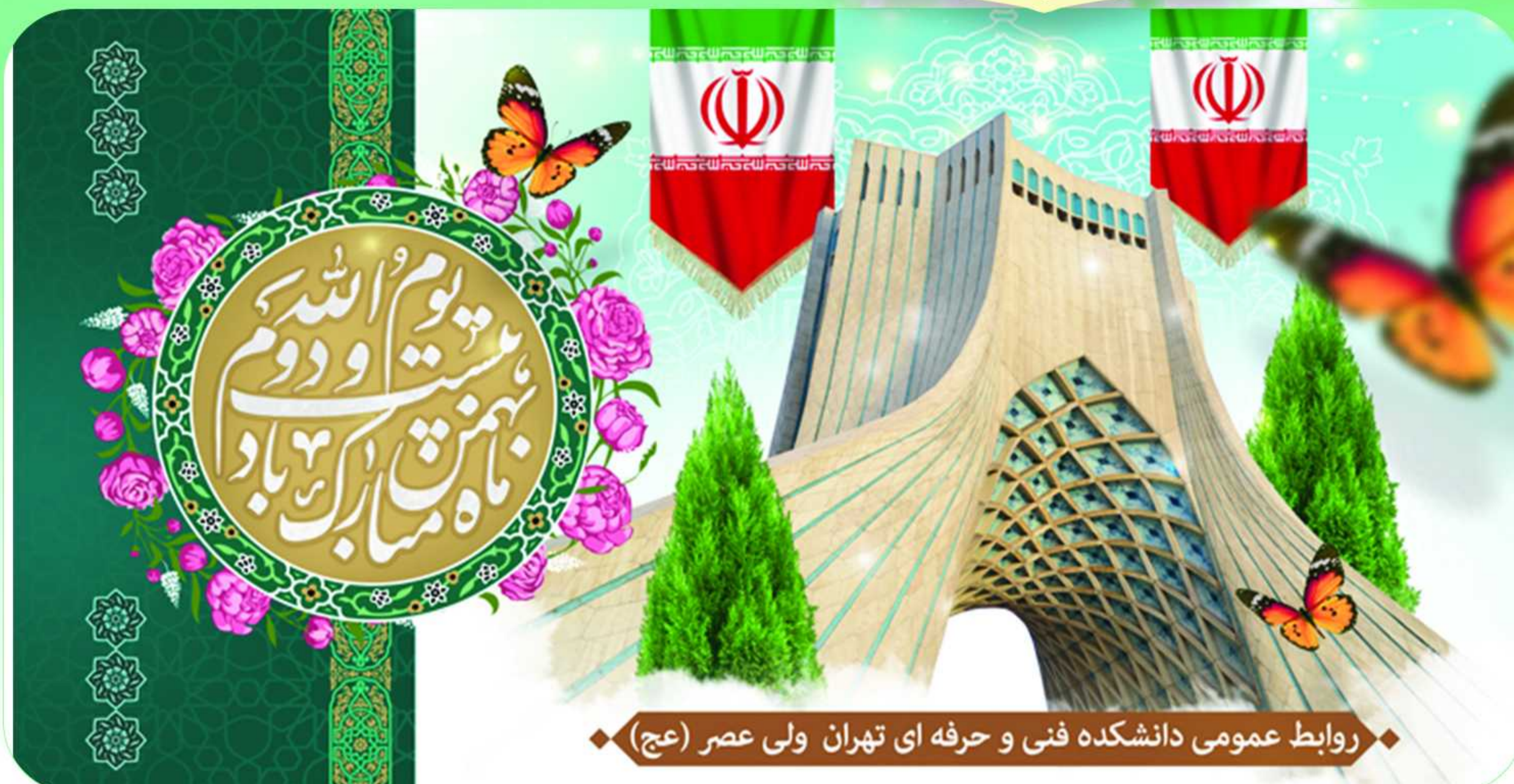
روابط عمومی دانشکده فنی و حرفه ای تهران ولی عصر (عج)

۲۲ بهمن روز تجدید عهد با انقلاب، امام و اسلام است.