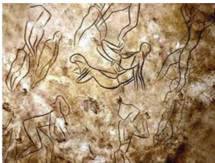
نقوش رقص آیینی در آدائورا- سیسیل ایتالیا