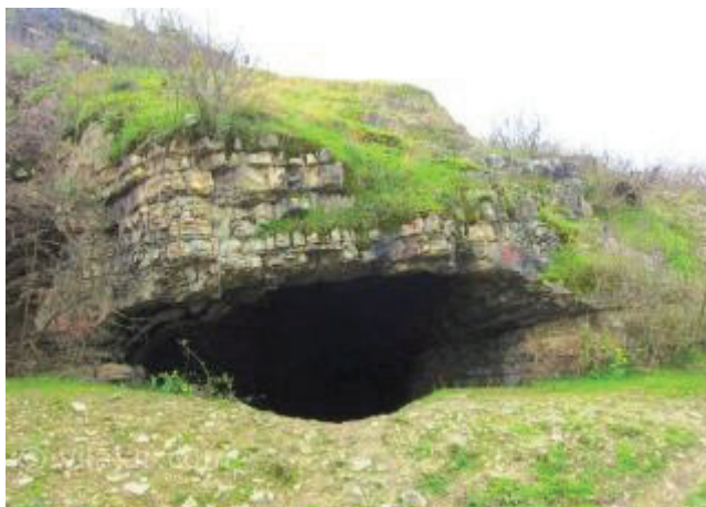
غار هوتو بهشهر - مازندران

• چادر نشینی و اهلی کردن حیوانات: رام کردن سگ برای شکار، محصول این دوران است. در این دوران شاهد استقرار طولانی تر انسان ها در یک مکان هستیم. از جمله زیستگاه های دوران میان سنگی در ایران می توان به ؛ غار مرخر در کرمانشاه، غار کنجی خرم آباد، غار مارروز در لرستان، غار هوتو و کمر بند مازندران، غار رودخانه کر در مرودشت فارس اشاره نمود.