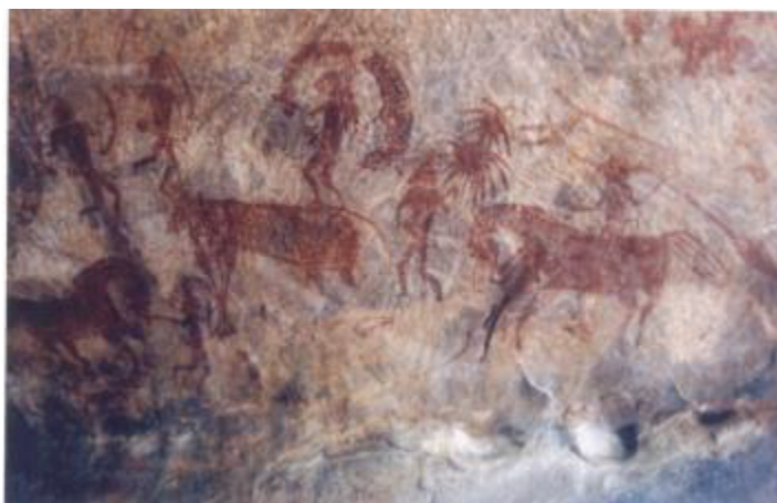
نقاشی صحنه شکار بر روی دیوار غار در بیمبتکا- هندوستان