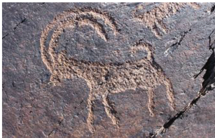
سنگ نگاره بزکوهی در رفسنجان کرمان