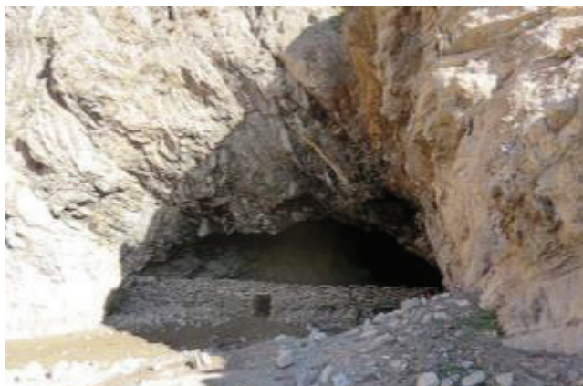
غار کونجی خرم آباد - لرستان