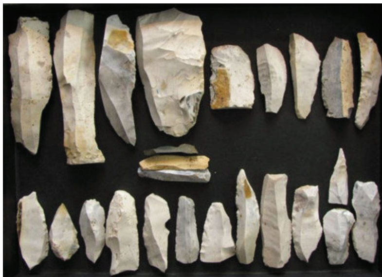
ابزارهای سنگی به دست آمده از دوران پارینه سنگی