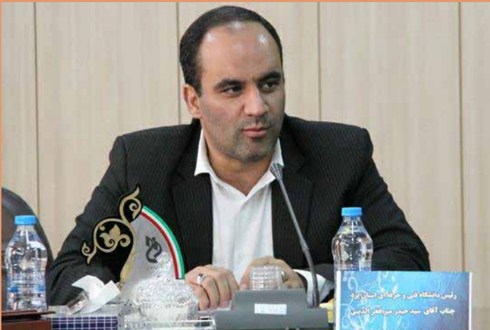
رئیس دانشگاه فنی و حرفه‌ای استان یزد :