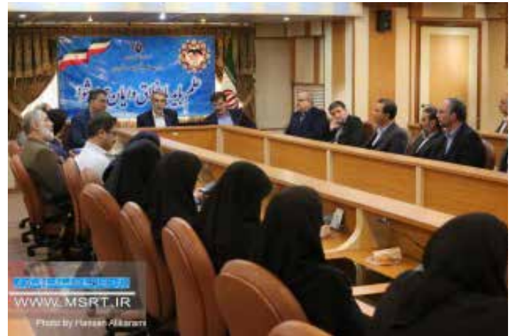
با حضور معاون اداری، مالی و مدیریت منابع وزارت علوم؛