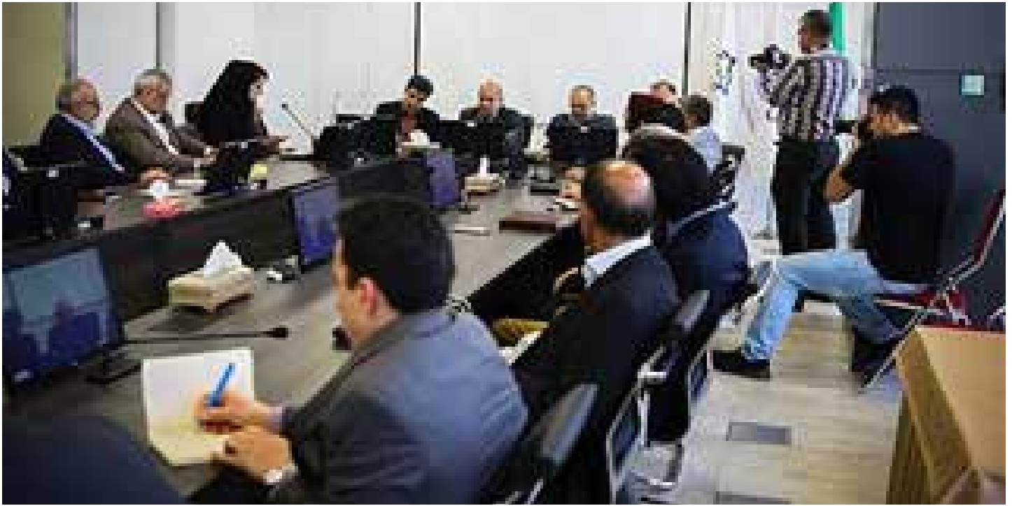
در زمینه ارتباط صنعت و دانشگاه: